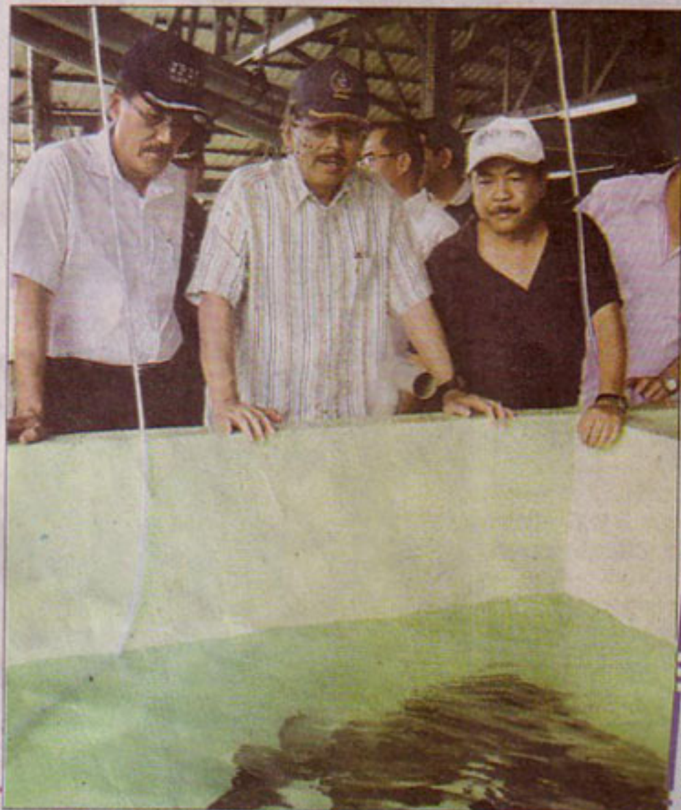
沙巴州首席部長拿督斯里邦里瑪慕沙阿曼(中)看好拿篤區域水產養殖前景。(011)