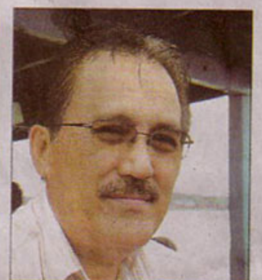
拿篤區州議員拿督納斯倫。(011)