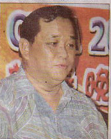
東谷區州議員拿督蘇海里。(011)