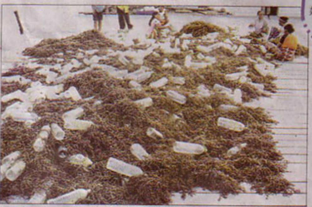
人工種植珊瑚海草經濟活動大熱崛起，已成為許多漁民另類的替代謀生之技。(011)