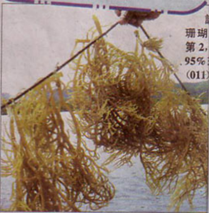
南區海域盛產的珊瑚草產量佔全州第2，該區珊瑚海草約95%自東谷區海域。(011)